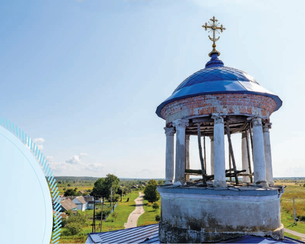
Бельведер на кровле храма