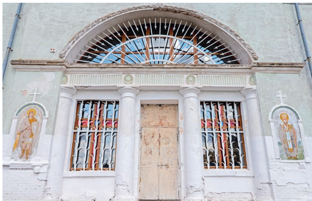
Решетки на окнах в расщеп — свидетельство крестьянского восстания