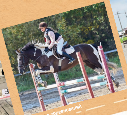
→ фото с соревнований