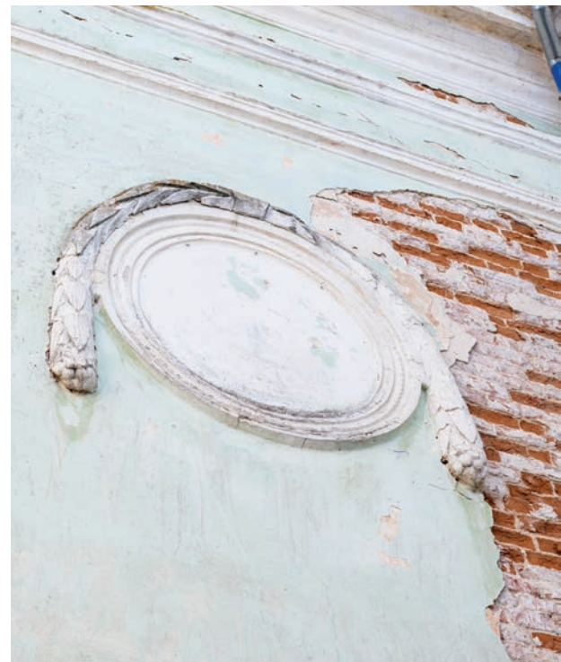
Лавровый венок — элемент лепного декора на фасаде храма