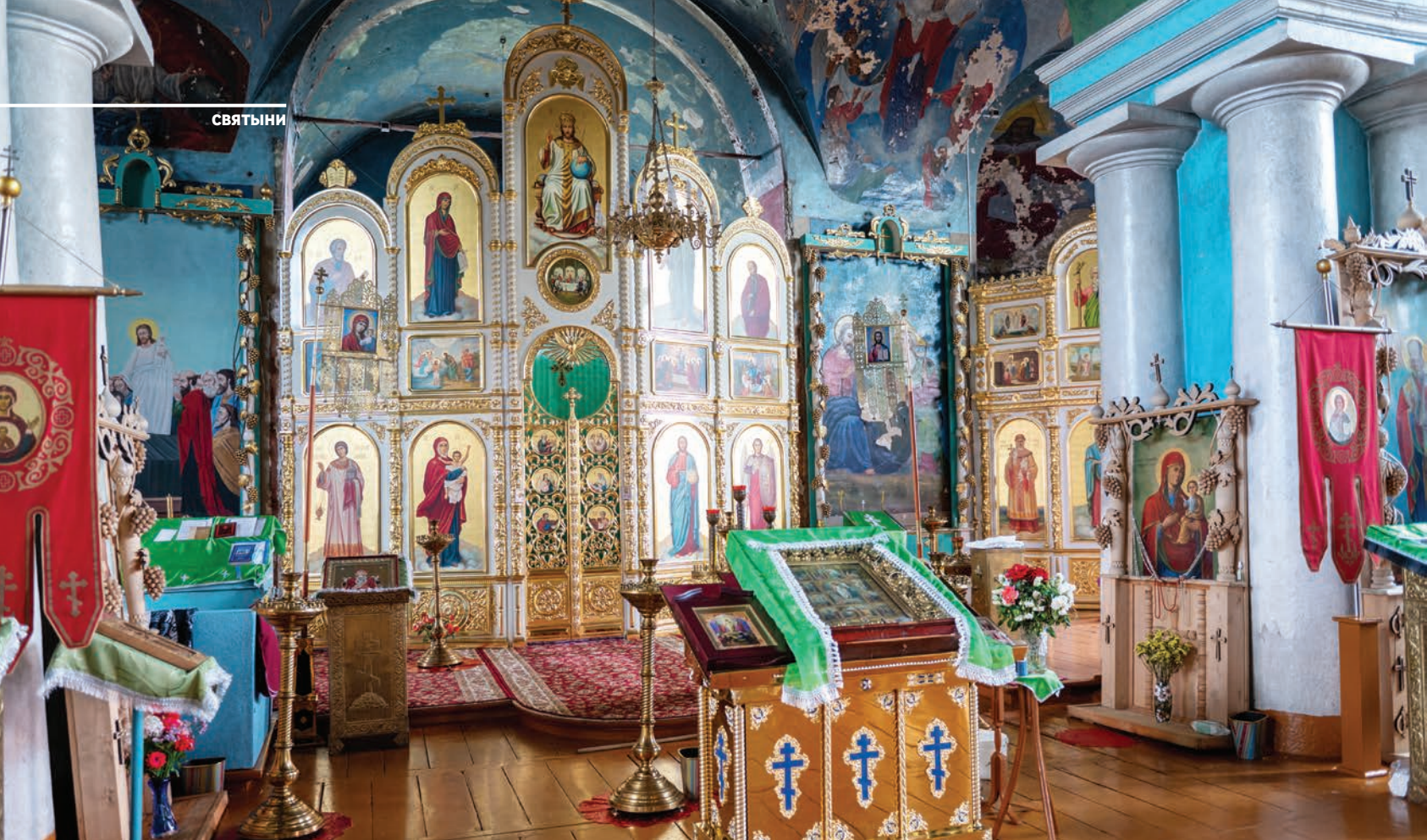
Успенский храм преобразил новый красивый иконостас, изготовленный в Волгодонске