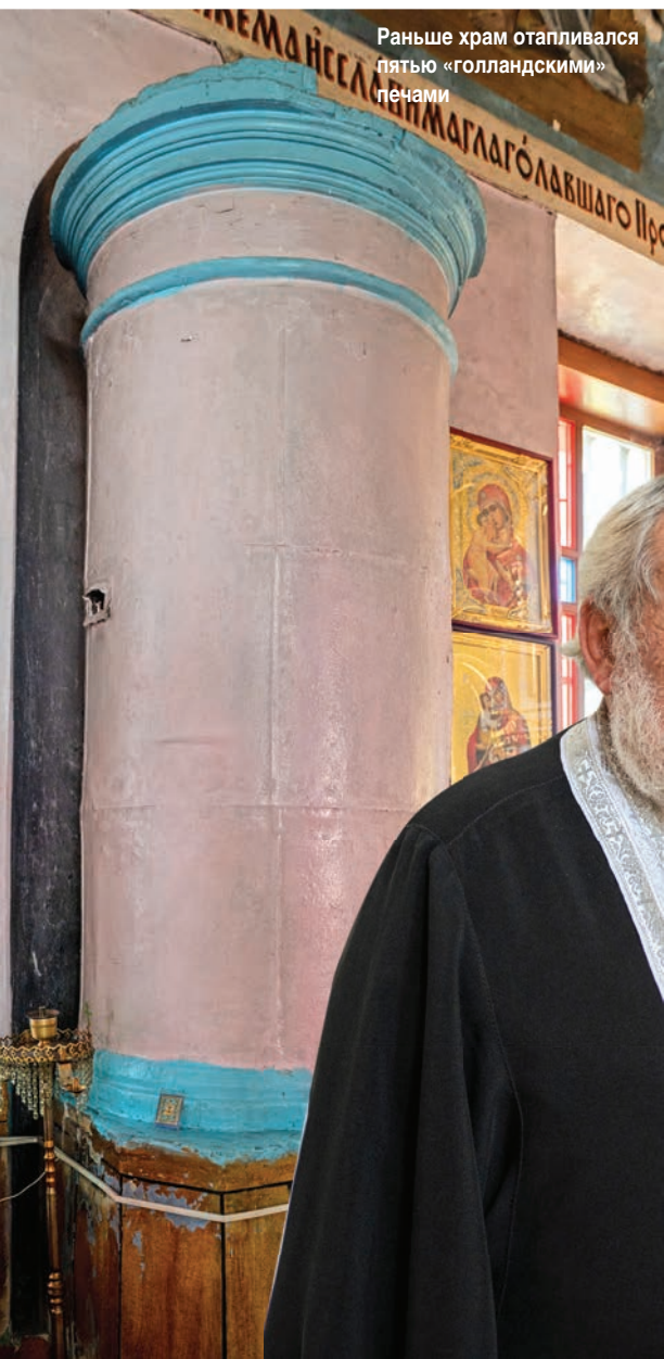
Раньше храм отапливался пятью «голландскими» печами