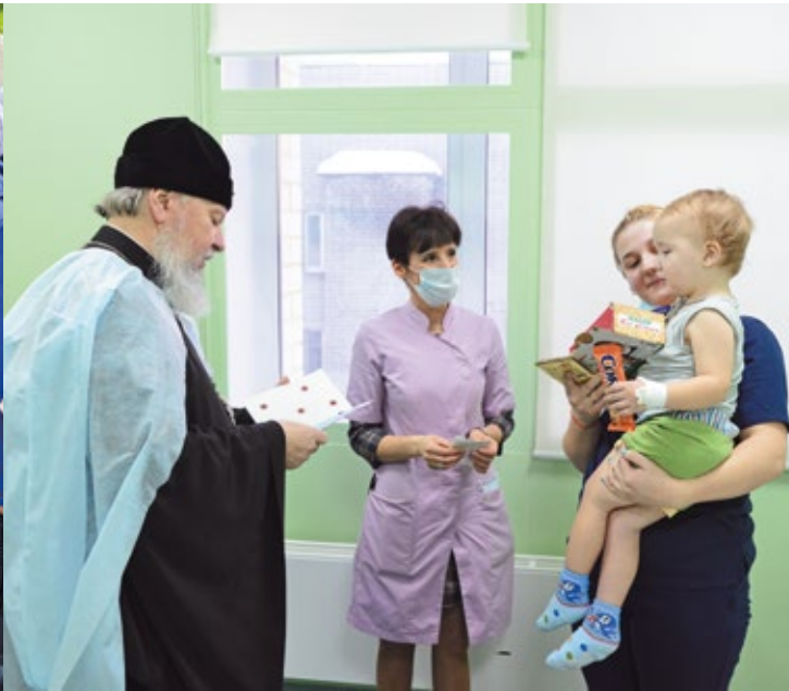
Посещение Брянского онкогематологического центра