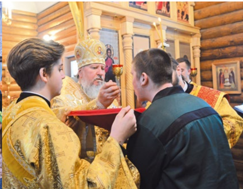
Духовное окормление осужденных в Брянской воспитательной колонии

надо понимать, чтобы построить даже маленький храм, нужно очень много средств, и поэтому без спонсорской поддержки не обойтись. В городе Брянске мы в основном осваиваем пустыри, заброшенные участки, потому что в парках строить запрещено, и мы как законопослушные граждане это требование соблюдаем. Но храмы возводятся для людей, и они должны быть в шаговой доступности, особенно в городах. Человек вышел из дома, тут поликлиника, аптека, магазин, детский сад, школа, Дом культуры и здесь же стоит храм. Поэтому необходимость в храмах есть, и они продолжают строиться. В этом году намечаем освятить 10 храмов, это не только вновь построенные, но и восстановленные.