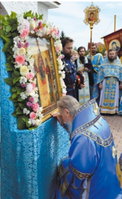
Крестный ход в праздник Свенской иконы Божией Матери