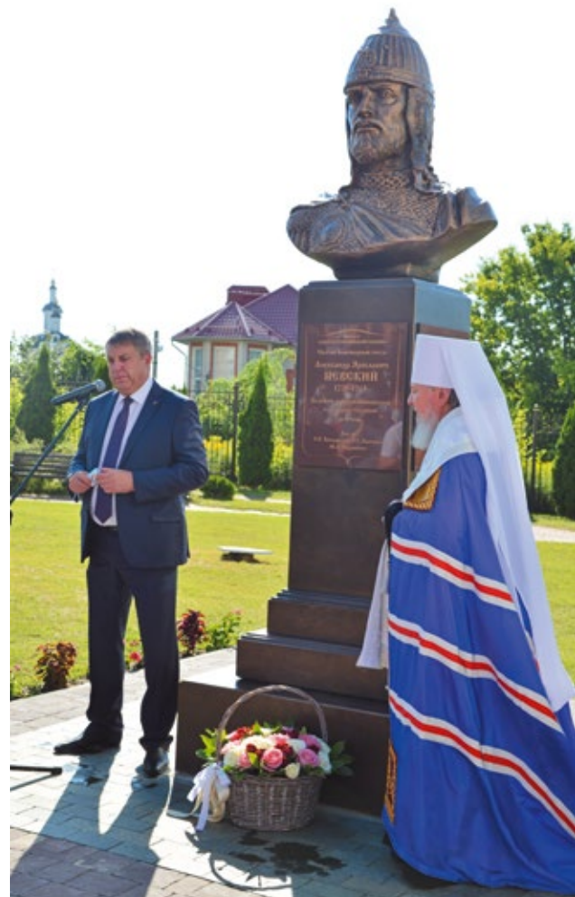
Губернатор Брянской области Александр Богомаз на открытии бюста святому князю Александру Невскому

— Самым сложным было лишить сана священника. Сложность заключалась в том, что он сам попросил об этом. Я служу в Церкви 49 лет, и это первый такой случай. Мне пришлось с величайшим трудом подписать бумагу. Но я не верю, что священного сана можно лишить росчерком пера, это благодать, которая остается со священником на всю его жизнь. И потом очень тяжело приходилось в период пандемии коронавирусной инфекции, мне надо было говорить людям, чтобы они не приходили в храм на общественную молитву, хотя я их всю жизнь призывал посещать дом Божий. Трудности были, когда долго не возвращали Спасо-Преображенский монастырь в городе Севске. В настоящее время он образован как женский, и там уже восстановлен сестринский корпус и домовый храм.