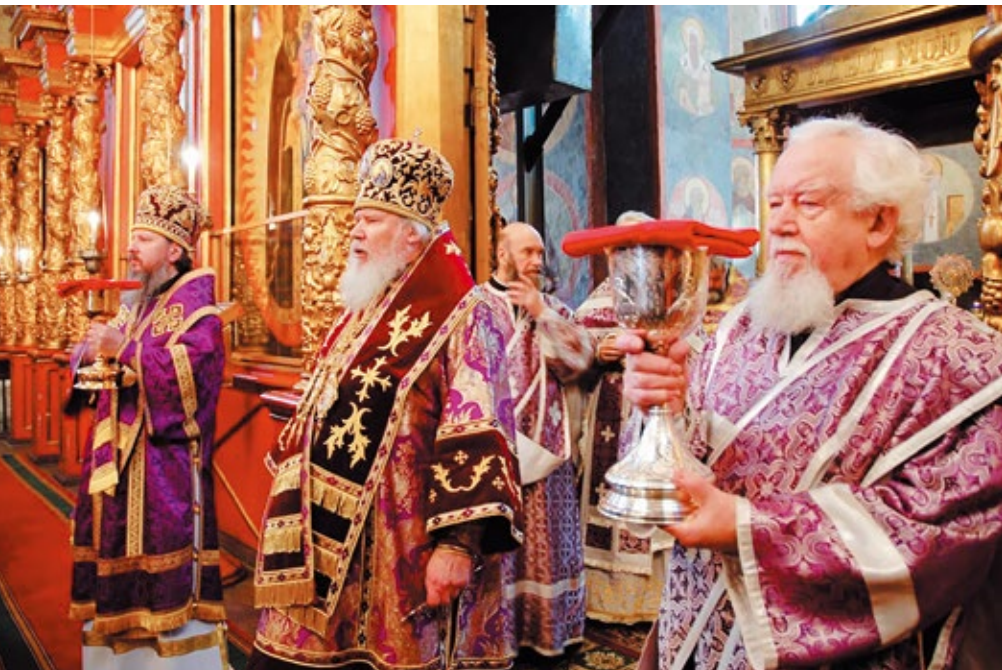
Владыка Александр 7 лет прослужил викарием Святейшего Патриарха Алексия II