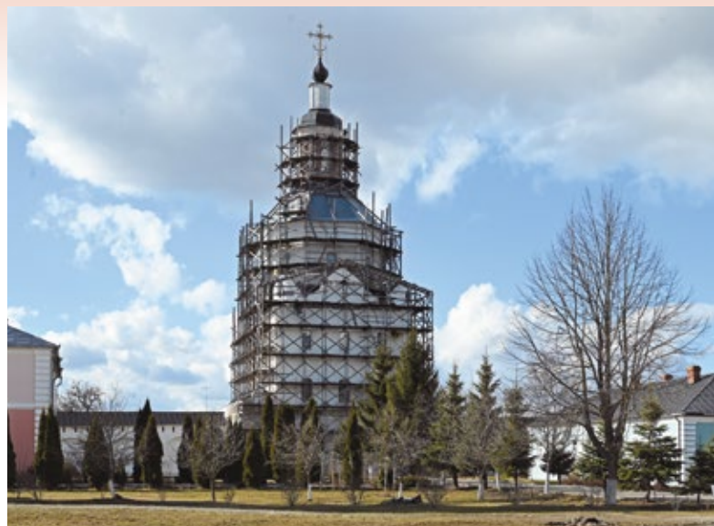
Реставрация Преображенского храма в Свенском монастыре

Свенского монастыря. Уже составлен хороший проект и скоро приступят к восстановительным работам. А так в основном за счет пожертвований благотворителей и прихожан. В Рогнедино в возрождении храма во имя святителя Алексея, митрополита Московского, принимают участие сами жители, несут кирпичи, подают их наверх мастерам. Как говорил академик Дмитрий Сергеевич Лихачев, памятники культуры принадлежат народу, и мы несем за них ответственность перед нашими потомками. Поэтому реставрация имеет колоссальное значение. «Историческую атмосферу наших городов нельзя зафиксировать никакими фотографиями, репродукциями и макетами. Эту атмосферу можно выявить, подчеркнуть реконструкциями, но можно и легко уничтожить — уничтожить бесследно. Она невосстановима. Надо хранить наше прошлое: оно имеет самое действенное воспитательное значение. Оно воспитывает чувство ответственности перед Родиной», — отмечал Лихачев.