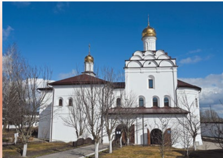
Храм Антония и Феодосия Печерских восстановлен по областной программе

— Это и областная программа по возрождению храмов, и федеральная. Но по ней могут реставрироваться только памятники архитектуры федерального значения. Таких у нас немного. В нее вошел Преображенский храм