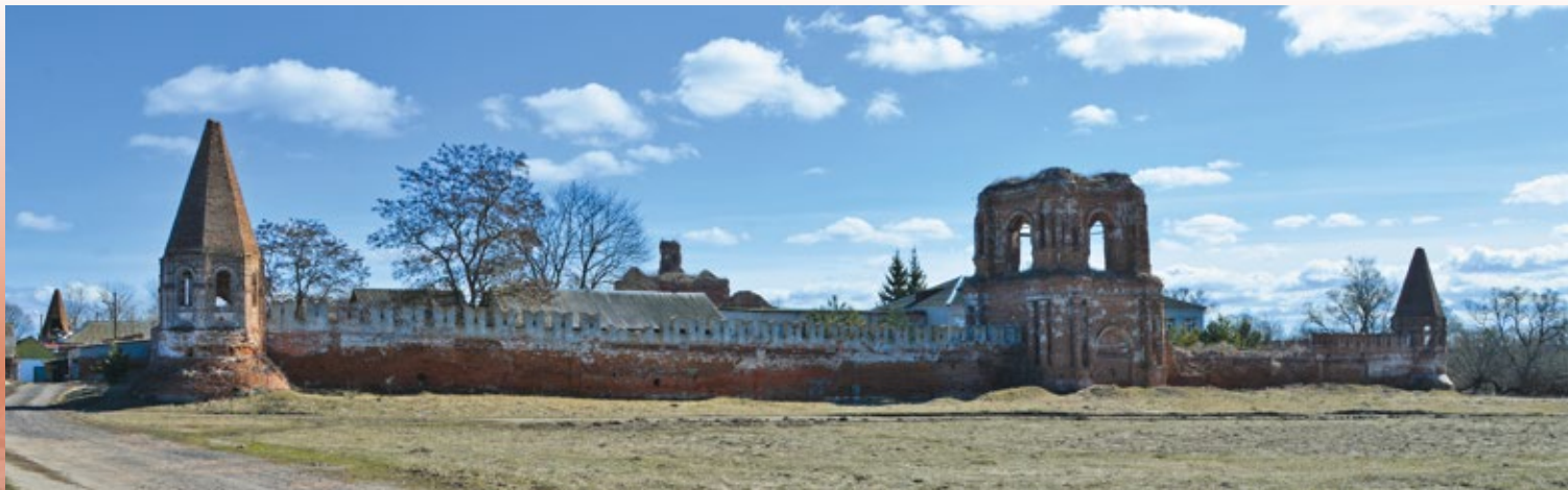
Севский Спасо-Преображенский женский монастырь — уникальный памятник архитектуры XVIII века

В советское время были марки, я приходил к маме и говорил, дай 15 копеек, мы на памятники сдаем. И это отложилось с детства, что я участвовал в реставрации разрушенных объектов. Смотрите, как просто и полезно. Здесь и воспитание детей, и реальная помощь.