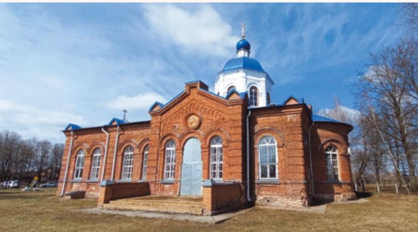
Трехпрестольный Никольский храм 1903 года постройки в поселке Старь Дятьковского района