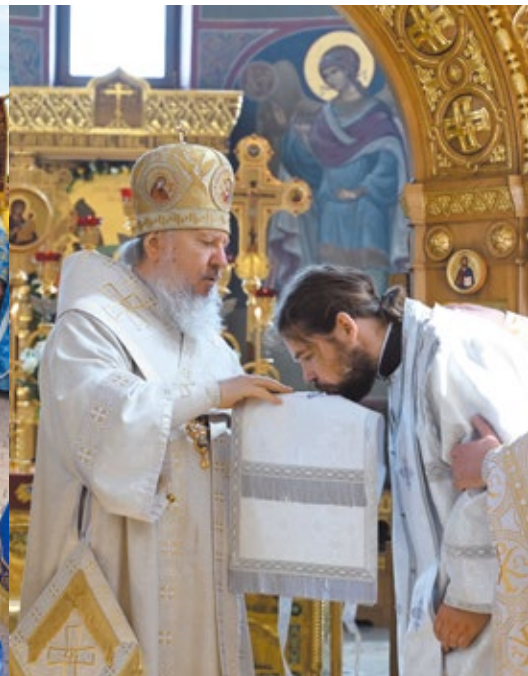
Хиротония во пресвитера