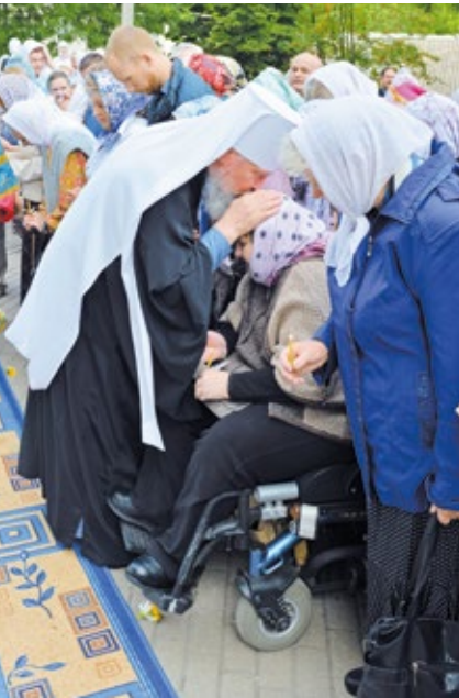
Архиерей благословляет верующих