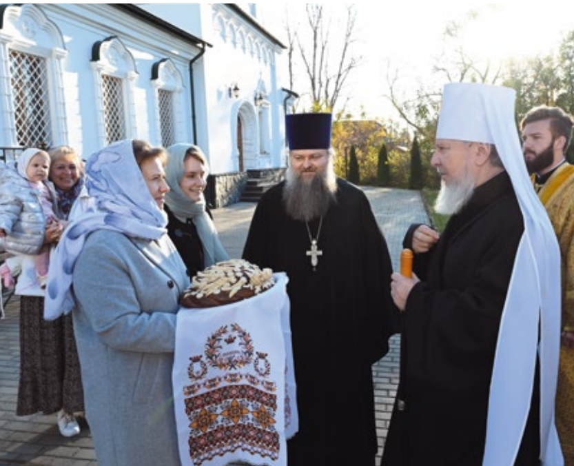
Встреча архиерея перед богослужением в старинном храме во Имя Святой Троицы поселка Бежичи по русской традиции проходит с хлебом-солью