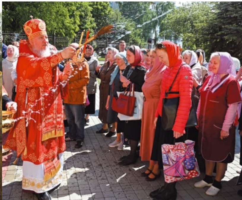
Пасхальный крестный ход вокруг Воскресенского храма в Брянске

«... Придите ко Мне все труждающиеся и обремененные, и Я упокою вас...». Конечно, вера у современных людей есть, может быть, не очень глубокая, но тем не менее. Хотя о вере судят по делам.