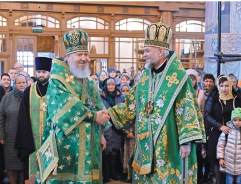
Митрополит Брянский и Севский Александр и епископ Клинцовский и Трубчевский Владимир в праздник Собора Брянских Святых