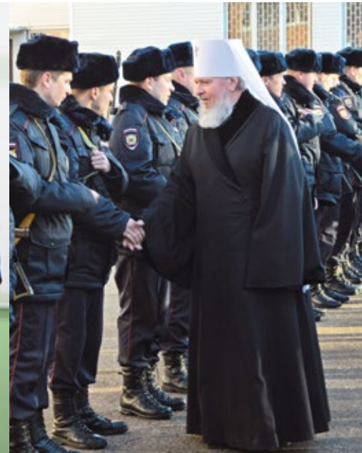
Благословение полицейских перед командировкой на Северный Кавказ