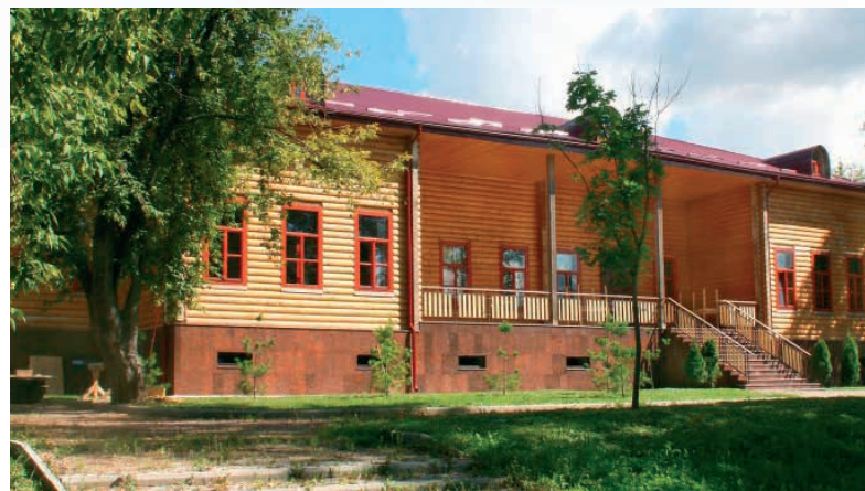
Немало сил было потрачено на восстановление резиденции московских митрополитов