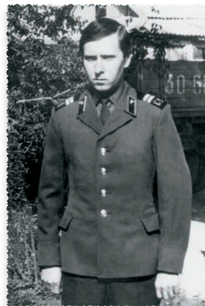
Во время службы в армии