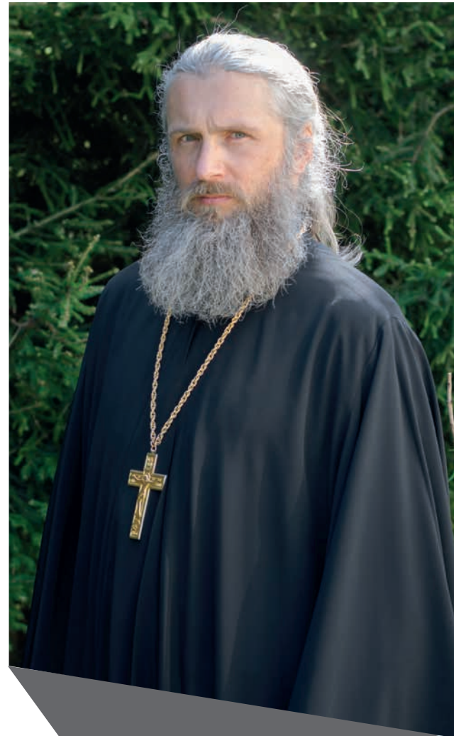
Размышления брянских священников записала Елена СТАРОДУМОВА

Нам очень мешает самомнение. С ним благодать уходит. Рассудок и книжные знания к такой любви не приводят — только работа над собой. Просите смирения. Но поймите, что придет испытание. Кто-то заденет вас, и тогда гнездящийся в душе змий самомнения исходит из своих темных тайников. И тогда смиряешься: Господи, не хочу быть таким, это не я, Господи, приди на помощь! Без смирения любви не достигнуть. А Богу нужно от нас одно — чтобы мы любили друг друга. Об этом и знаменитая «Песнь любви» апостола Павла: «Любовь долготерпит, милосердствует, любовь не завидует, любовь не превозносится, не гордится, не бесчинствует, не ищет своего, не раздражается, не мыслит зла, не радуется неправде, а сорадуется истине; все покрывает, всему верит, на все надеется, все переносит» (1 Кор. 13:1). Тогда подобные вопросы о разграничении добродетели и греха отпадают сами собой.