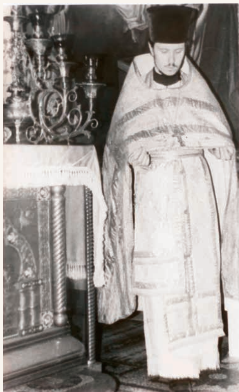
В Никольской церкви города Лосино-Петровска