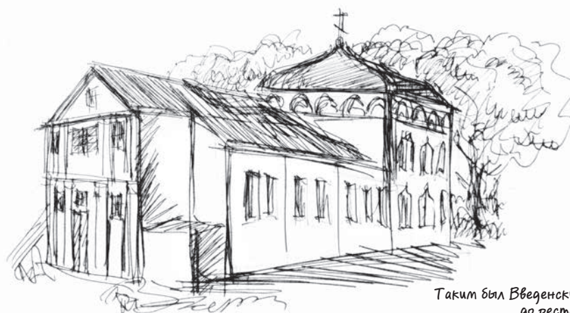
Таким был Введенский храм до реставрации