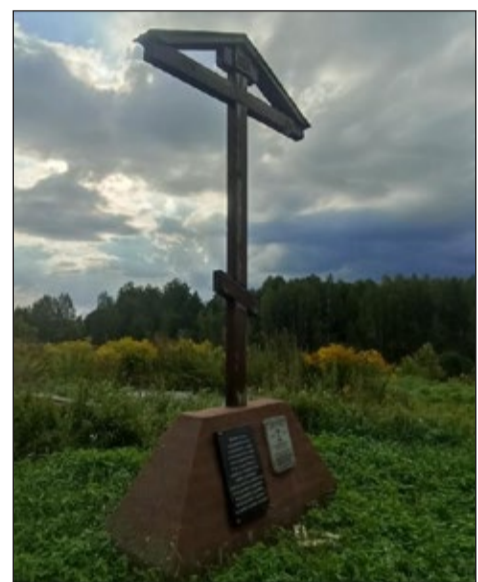
Начаты восстановительные работы.

В настоящее время здание храма возвращено Брянской Епархии.