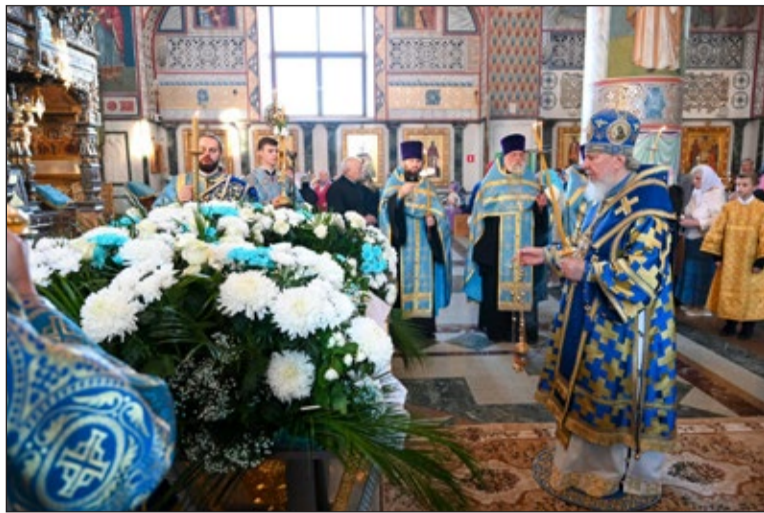
матери. Перед Святой Плащаницей с изображением Успения Пресвятой Богородицы Владыка Александр и священнослу-

Чин Погребения Божией Матери — это особое богослужение, во время которого воспоминается успение и погребение в Гефсимании Бого-